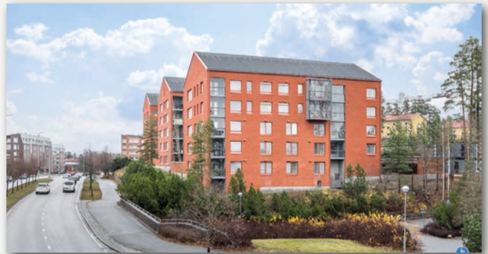
As Oy Tuusulan Kenraali