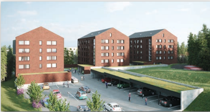
As Oy Tuusulan Majuri