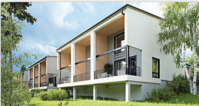
As Oy Vantaan Viherkaarre