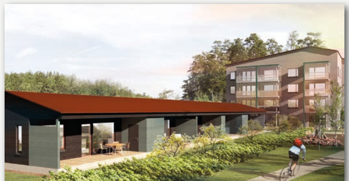
As Oy Kangasalan Veturi